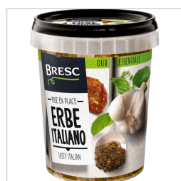
Bresc Herbes italiennes 450g