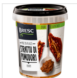
Bresc Purée de tomates séchées au soleil 450g