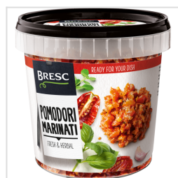
Bresc Tomates émincées et marinées 1000g