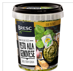
Bresc Pesto alla Genovese 450g