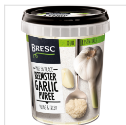
Bresc Purée d'ail hollandais du Beemster 450g