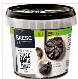
Bresc Purée d'ail noir 325g