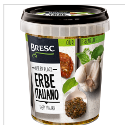
Bresc Herbes italiennes 450g