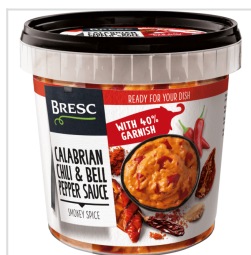
Bresc Sauce calabraise au piment et poivrons 1000g