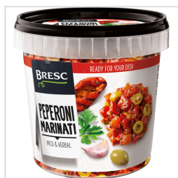
Bresc Poivrons émincés et marinés 1000g