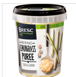
Bresc Purée de citronnelle 450g