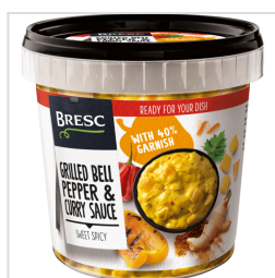
Bresc Sauce au poivrons grillés et curry 1000g