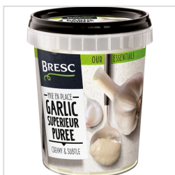
Bresc Purée d'ail supérieur 450g