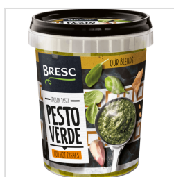
Bresc Pesto vert 450g