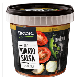
Bresc Salsa à la tomate 1000g