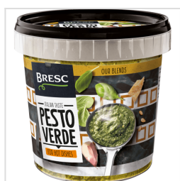
Bresc Pesto vert 1000g