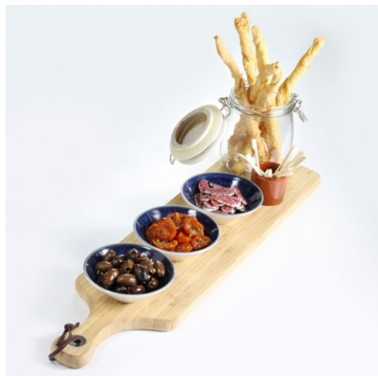
PLANCHE APÉRO AVEC TOMATES CERISES À L'AIGRE-DOUCE