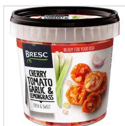
Bresc Tomates cerises à l'aigre-douce, ail et citronnelle 1100g