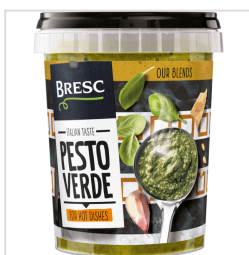
Bresc Pesto vert 450g