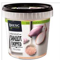
Bresc Échalote hachée 1000g