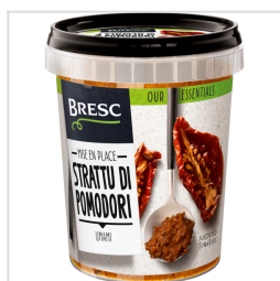
Bresc Purée de tomates séchées au soleil 450g