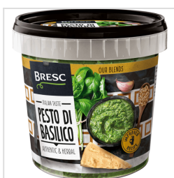
Bresc Pesto de basilic 1000g