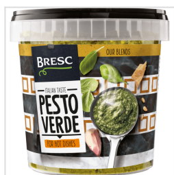
Bresc Pesto vert 1000g