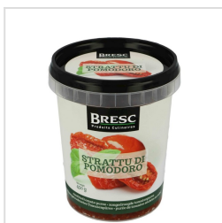
Zongedroogde tomatenpuree 450g