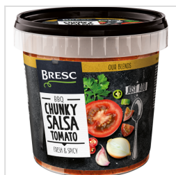
Bresc Salsa met grove tomatenstukjes 1000g