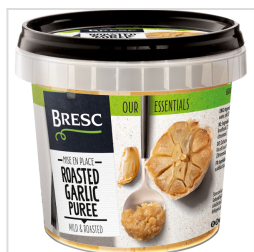
Bresc Geroosterde knoflookpuree 325g