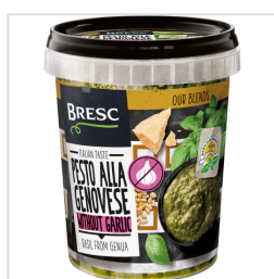
Pesto alla Genovese zonder knoflook 450g