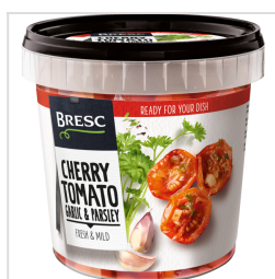
Bresc Zoetzure cherrytomaten knoflook peterselie 1100g