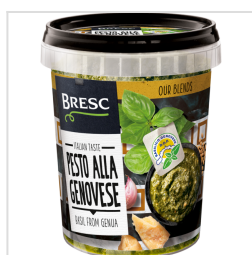
Bresc Pesto alla Genovese 450g