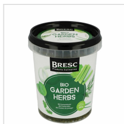
BIO Tuinkruiden 450g