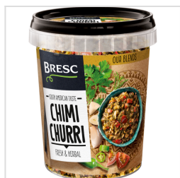
Chimichurri kruidenmix 450g