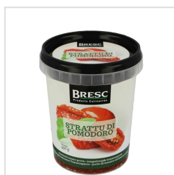
Zongedroogde tomatenpuree 450g