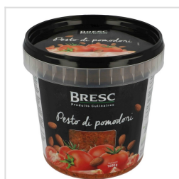
Pesto van tomaat 1000g