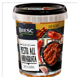
Bresc Pesto all'Arrabbiata 450g