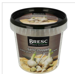
Knoflook gehakt 1000g