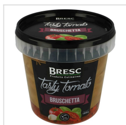
Tomaten bruschetta 1000g