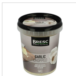
Knoflook gehakt 450g