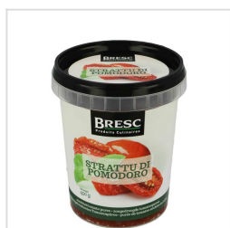
Zongedroogde tomatenspuree 450g