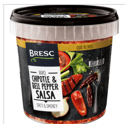
Chipotle en Paprika salsa 1000g