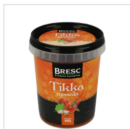
Tikka masala 450g