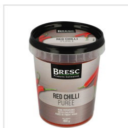
Rode peperpuree 450g